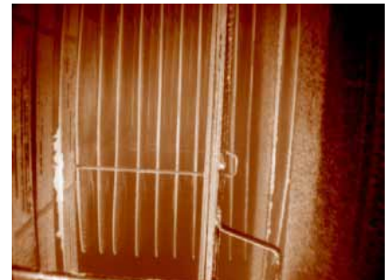
Überhitzerzone im 700-MW-Heizkessel, (Steinkohlebefeuerung)

LumaSense Thermographiekameras und -systeme werden von zahlreichen Kunden weltweit eingesetzt, zur Thermographiemessung in der Stromerzeugungs-, Raffinerie-, Stahl-, Papier- und Glasindustrie. Für unsere Systeme bieten wir umfangreichen Kunden- Support an, besonders hervorzuheben ist hier unser neues LumaServ Angebot.